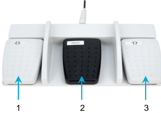
Resim 2: Liposat® / Vibrasat® Footswitch (3 pedallı)