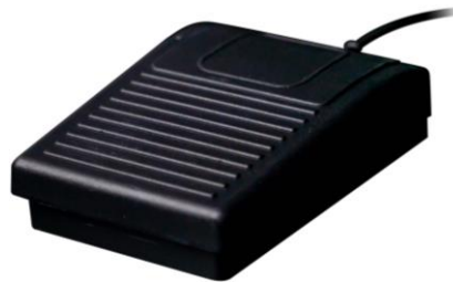
Mynd 1: Liposat® / Vibrasat® Footswitch (1-pedali)

Hægt er að ræsa og stöðva tækin með því að ýta á hnappinn. 1 pedallinn Liposat® / Vibrasat® Fótrofi hafa eftirfarandi pöntunarnúmer: